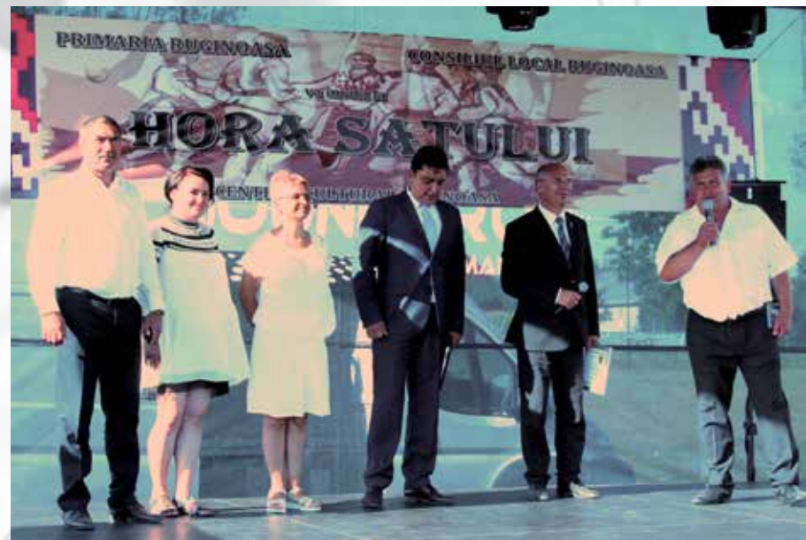
Zilele comunei Ruginoasa