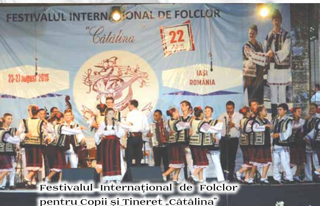
Festivalul Internațional de Folclor pentru Copii și Tineret „Cătălina”