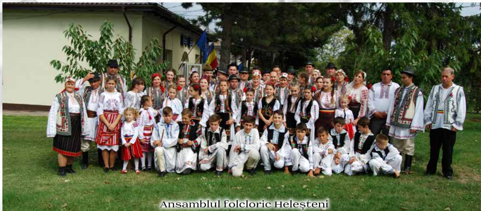
Ansamblul folcloric Heleșteni