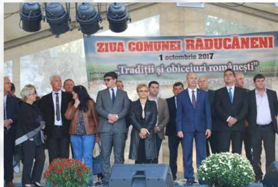
Zilele comunei Răducăneni