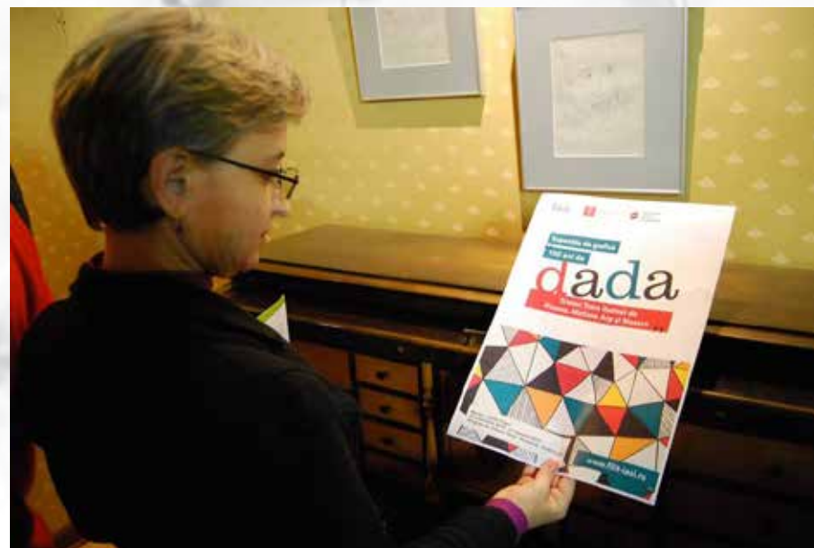
Vernisajul expoziției „100 de ani de Dada”, la Muzeul Național al Literaturii Române din Iași