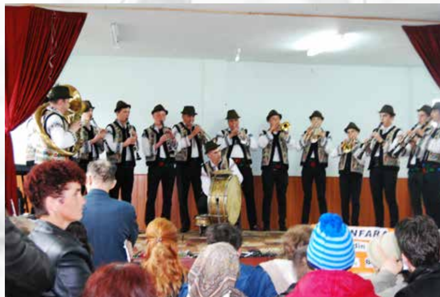
Festivalul fanfarelor de la Cozmești