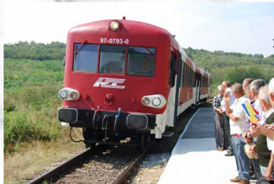
Inaugurarea haltei Vlădeni