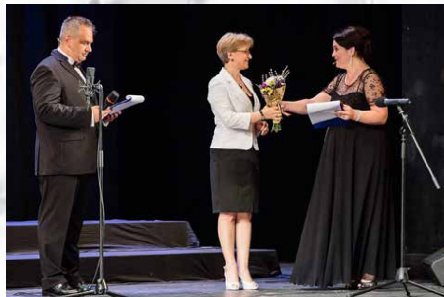
Gala Festivalului "Gavriil Musicescu"