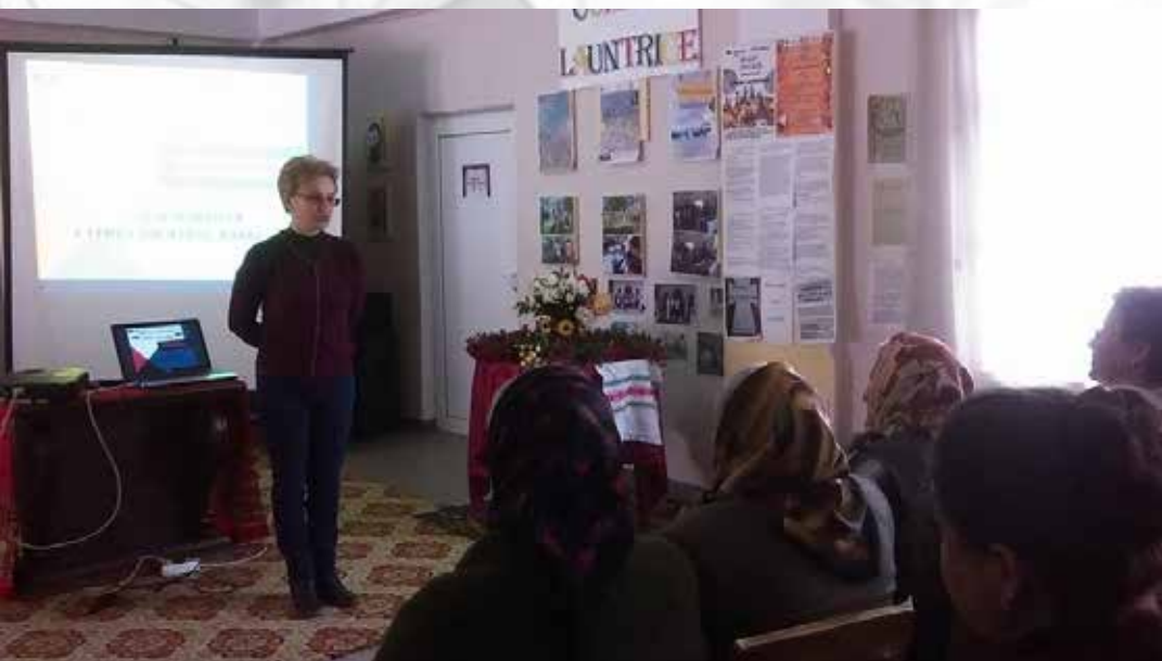
Festivalul „Comori Lăuntrice”, Ruginoasa