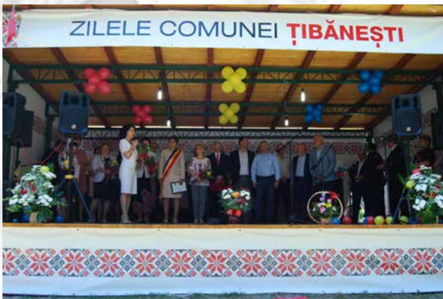
Zilele comunei Țibănești