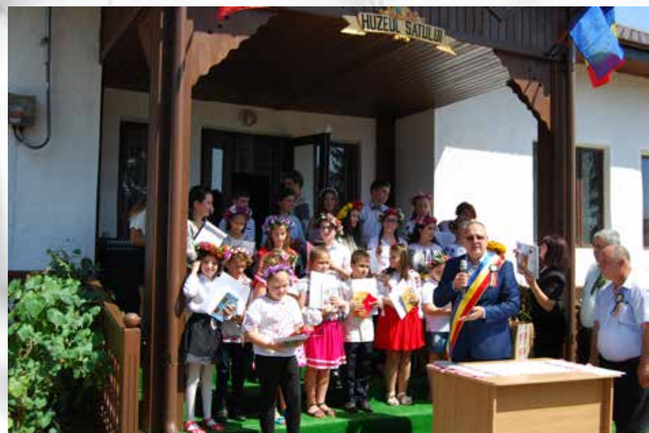
Zilele comunei Tătăruși