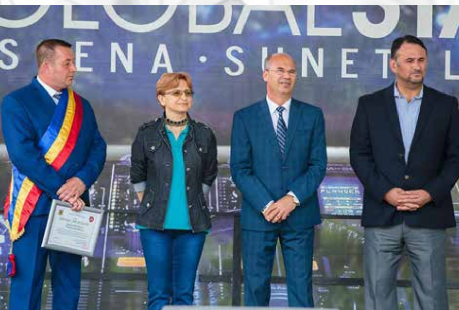
Zilele comunei Bârnova