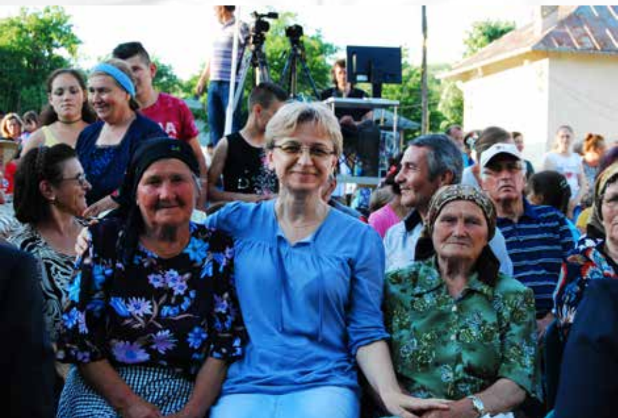
Zilele comunei Moșna