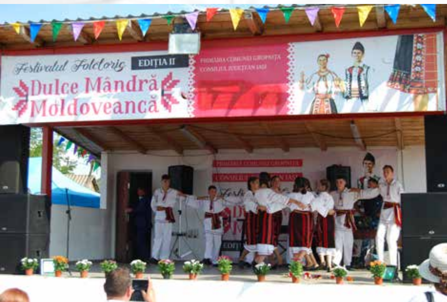
Festival folcloric la Gropnița