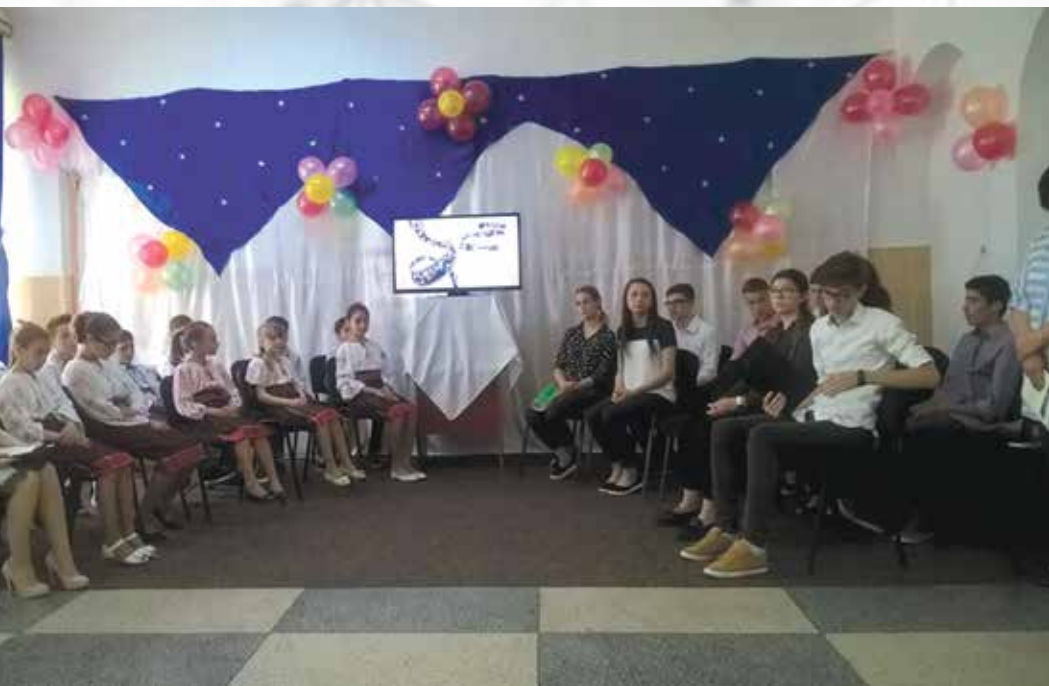
Centrul de excelență al DGASPC Iași

În anul 2017, în exercitarea mandatului de consilier județean am participat împreună cu executivul Județului Iași la numeroase evenimente organizate de primăriile din județ și la evenimente organizate cu prilejul unor zile omagiale sau comemorative, cum au fost „Ziua Unirii Principatelor”, „Ziua Eroilor”, „Ziua Drapelului”, „Ziua Națională a Românie”. Am avut în vedere ca întreaga mea activitate desfășurată în 2017, în calitate de consilier județean, să fie una constructivă, venind în sprijinul autorității executive și promovând constant interesele comunității. Am urmărit să contribuim la dezvoltarea județului Iași, la îmbunătățirea calității vieții cetățenilor săi.