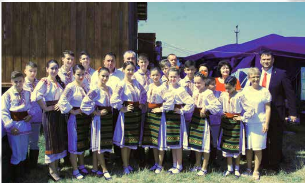
Zilele comunei Moțca