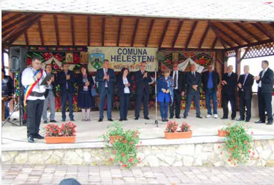
Zilele comunei Heleșteni