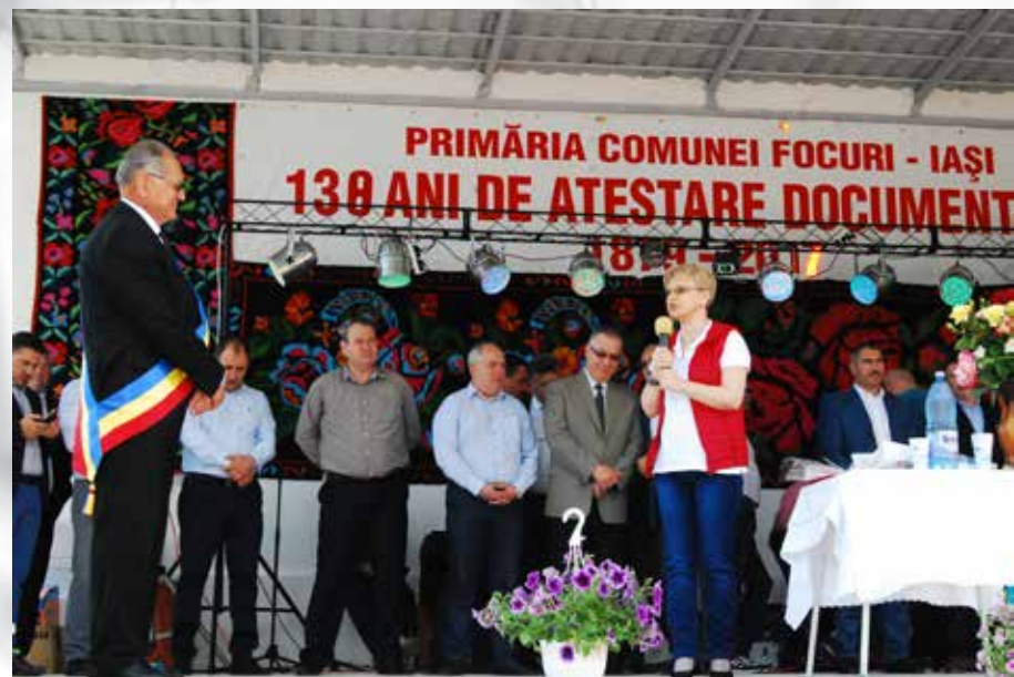
Zilele comunei Focuri