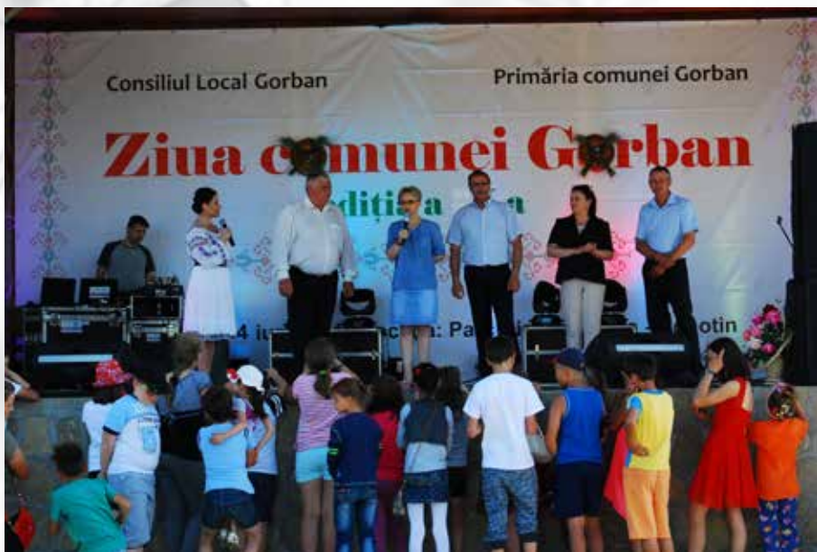
Zilele comunei Gorban