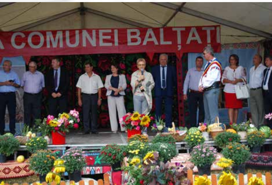
Zilele comunei Bălțați