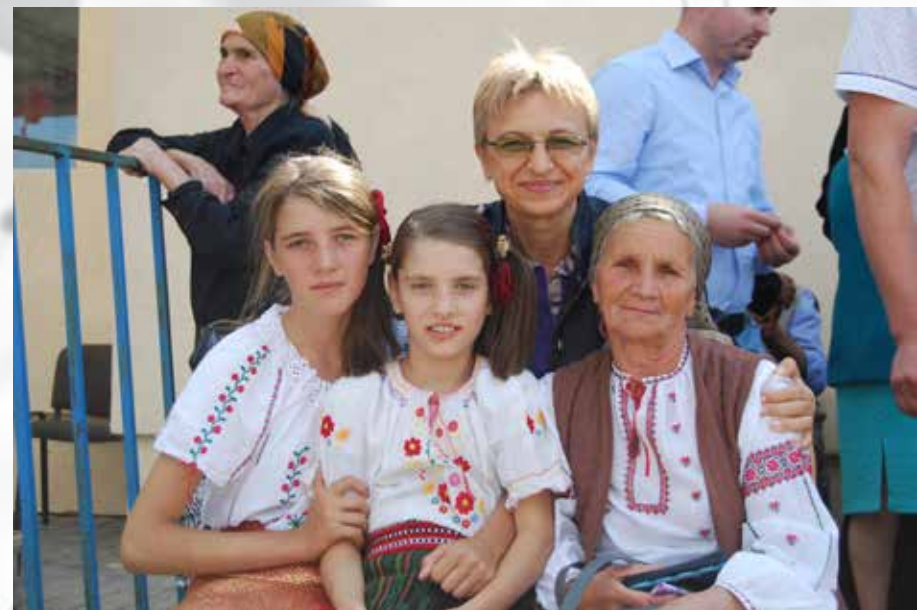
Zilele comunei Șipote