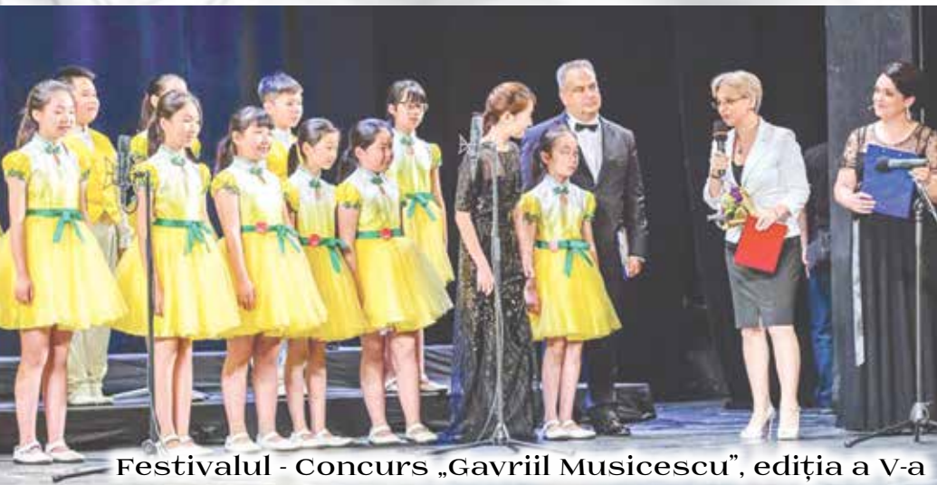
Festivalul - Concurs „Gavriil Musicescu”, ediția a V-a