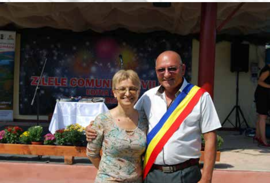
Zilele comunei Movileni