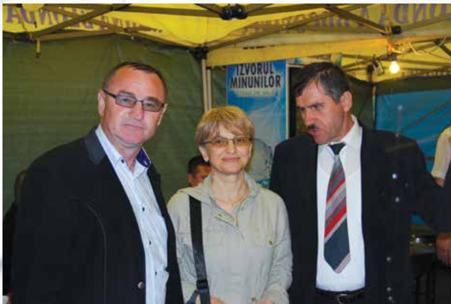
Hramul satului Bohotin