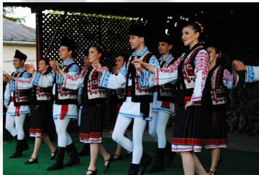
Zilele comunei Moșna