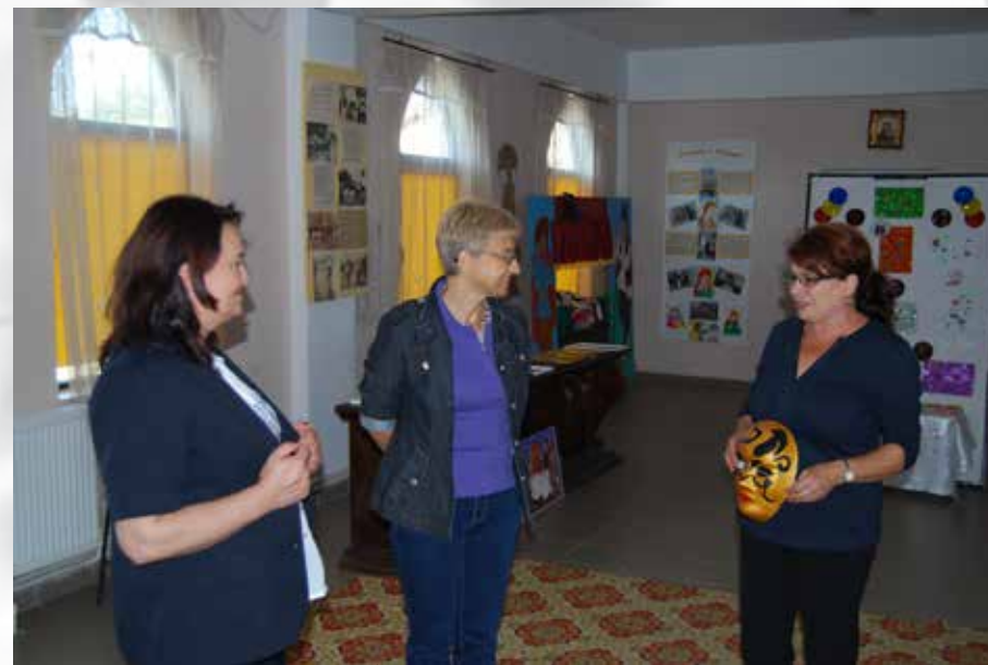
Centrul cultural Ruginoasa