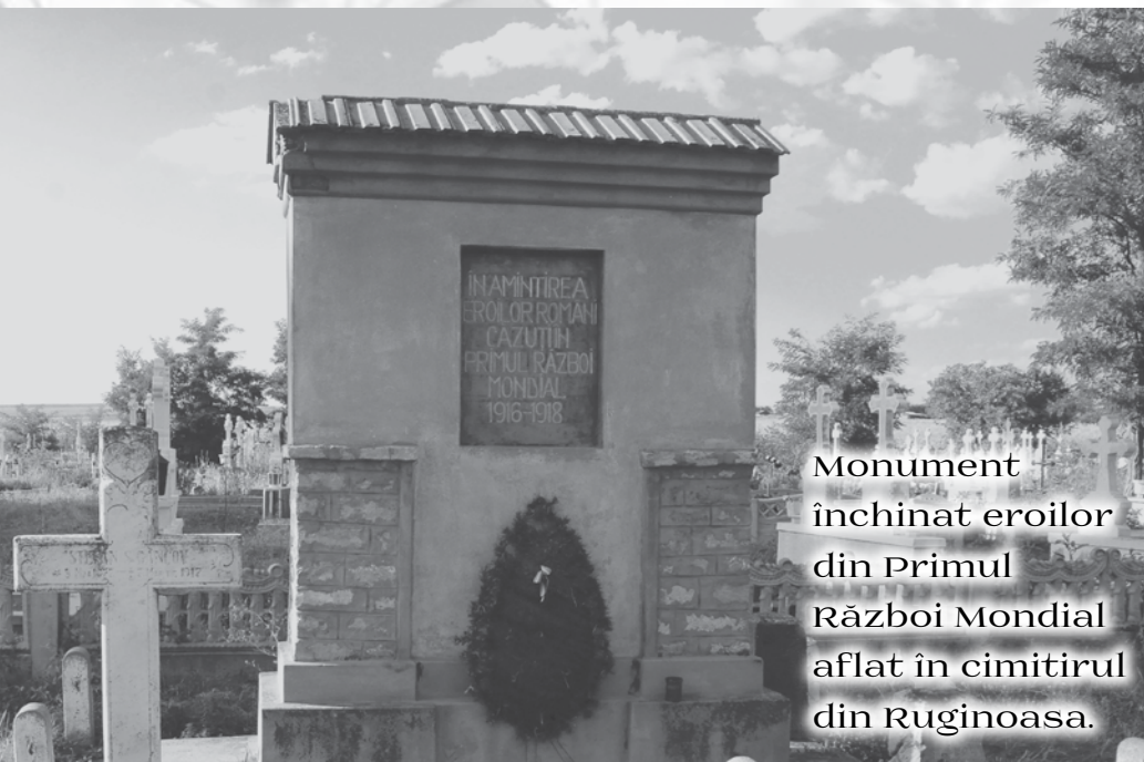
Monument închinat eroilor din Primul Război Mondial aflat în cimitirul din Ruginoasa.

3. Pentru a reaminti rolul jucat de cetățenii județului Iași în perioada 1916 - 1918, perioadă în care municipiul a fost capitala de război a țării, și în foarte multe localități au fost organizate spitale de campanie și adăposturi pentru românii refugiați din zona ocupată a României,