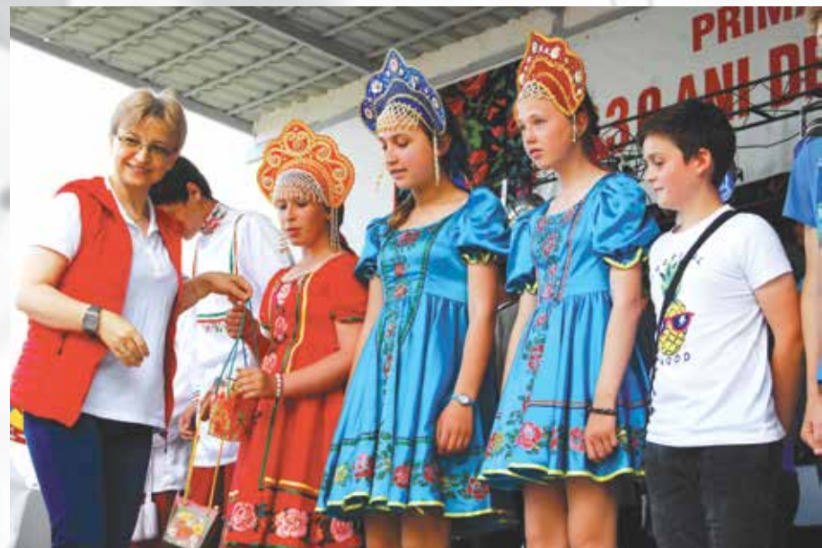
Copii premiați din comuna Focuri